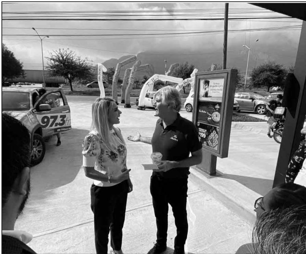
Un restaurante canadiense llegó a territorio de Santa Catarina

"Es de decir que el diseño de esta sucursal tiene un diseño innovador y con el 100% del ingenio mexicano, los contenedores del inmueble son traídos de importación de Tampico, este es un diseño único de Tim Hortons México y luego de una presentación en Las Vegas se prevé que en California se comience a utilizar el novedoso diseño", agregó. (AME)