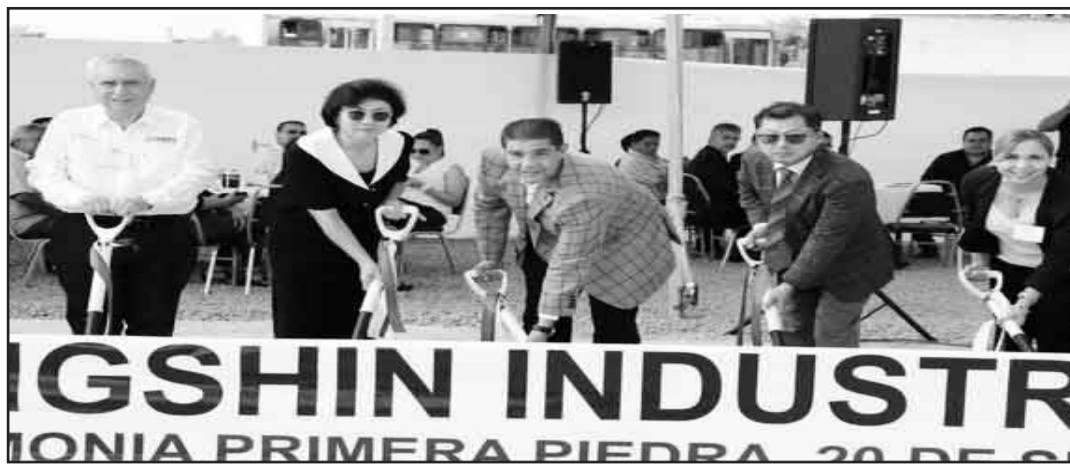
El alcalde Francisco Treviño encabezó la colocación de la primera piedra